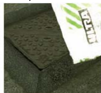
IRR aukstā asfalta iebēršana