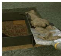
Aizbēršana, izmantojot QC10