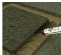
Vertikālo malu apstrādāšana ar SCJ