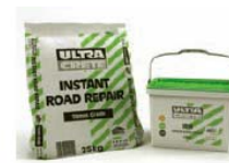
Ultracete IRR Aukstā ieklājuma asfalts

Zemāk esošajos attēlos parādīti pasākumi no sākotnējās asfalta izlaušanas līdz beigu virsmas atjaunošanai. Izmantojot BBA/HAPAS apstiprināto konstrukciju atjaunošanas sistēmu, autoceļi var palikt vajā tikai 1 stundu instalēšanai, izmantojot Ultracete PY4 vai pagarinot līdz 2 stundām, instalējot ar Ultracete M60.