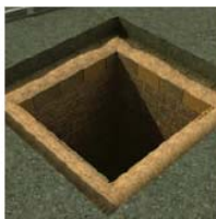
Mūrēšana ar PY4/M60