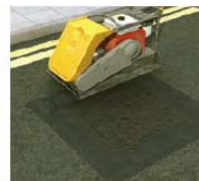
Beigu IRR asfalta sablīvēšana