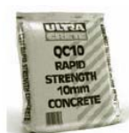
Ultracete QC10 Betons - aizpildītājs