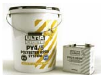
Ultracete PY4 Poliestera mūrēšanas java (HA104)